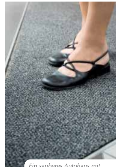
Ein sauberes Autohaus mit Schmutzfangmatte von MEWA.