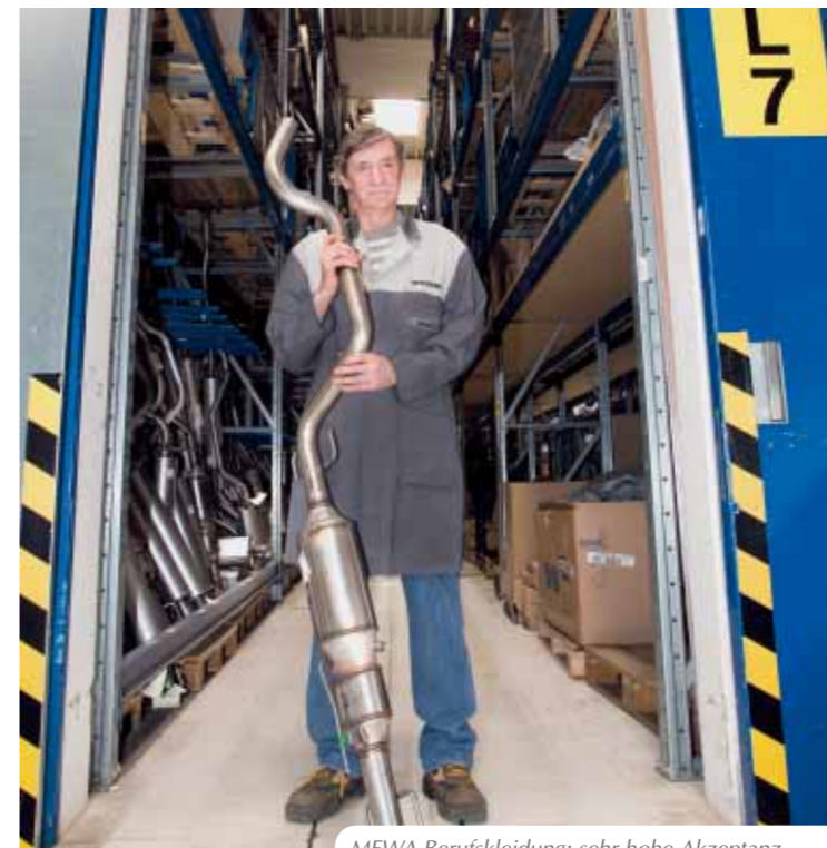
MEWA Berufskleidung: sehr hohe Akzeptanz bei den Mitarbeitern.