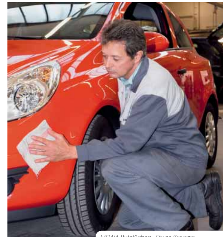
MEWA Putztücher: „Etwas Besseres kann es nicht geben!“